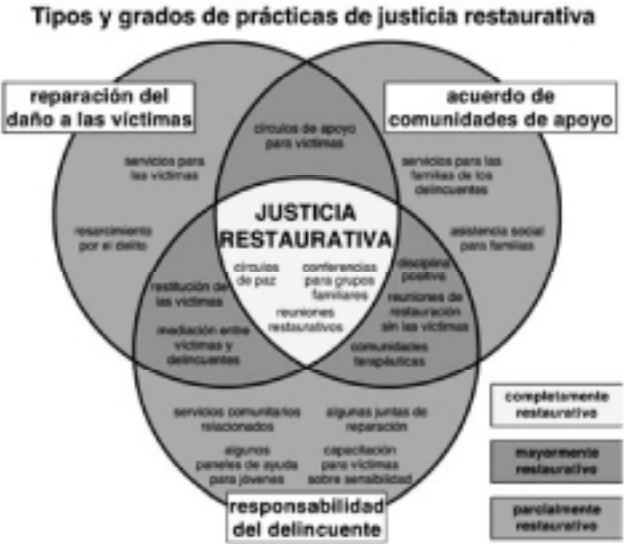
Figura 3. Tipología de las prácticas restaurativas

La justicia restaurativa es un proceso que involucra a las partes interesadas primarias en la decisión sobre la mejor manera de reparar el daño ocasionado por un delito. Las tres partes interesadas primarias en la justicia restaurativa son las víctimas, los delincuentes y sus comunidades de apoyo, cuyas necesidades son, respectivamente, lograr la reparación del daño, asumir la responsabilidad y llegar a un acuerdo. El grado en que las tres partes participan en intercambios emocionales significativos y la toma de decisiones es el grado según